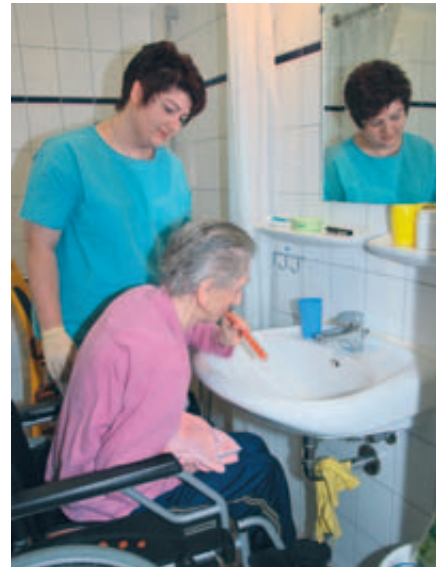
Immer wieder notwendig: Zähneputzen unter Anleitung

Pflegern, aber auch pflegenden Familienangehörigen empfehlen wir, sich mithilfe der ortsansässigen zahnärztlichen Kollegen und zahnärztlichen Vereinen fortzubilden. Wichtig ist, dass sie auch Kenntnis über die verschiedenen Zahnersatzmöglichkeiten und deren Aufbauten erhalten, um die auf Seite 4 genannten Einteilungen bei den Patienten vornehmen zu können.