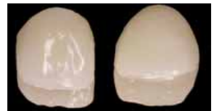
Keramikkrone auf dem Modell des Zahntechnikers: Man sieht deutlich die Lichtdurchlässigkeit des Materials.