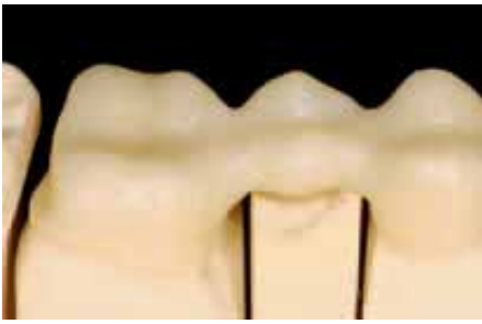
Zahnfarben eingefärbtes Zirkondioxidgerüst – noch ohne Verblendung