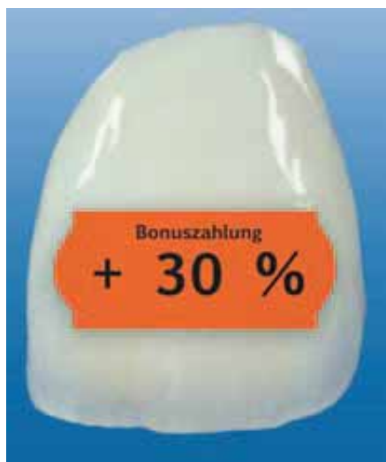
Die gesetzlichen Krankenkassen zahlen bis zu 30 Prozent mehr Festzuschuss zu Zahnersatz, wenn man regelmäßige Zahnkontrollen nachweist

In der gesetzlichen Krankenversicherung gilt per Gesetz der Grundsatz, dass eine Versorgung, die von der Krankenkasse bezahlt werden soll, „ausreichend, zweckmäßig und wirtschaftlich“ sein muss, nicht weniger, allerdings auch nicht