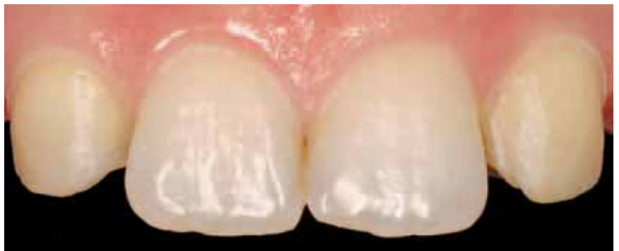
Bei einer Patientin sind die seitlichen Schneidezähne nicht angelegt; die Eckzähne sind an die mittleren Schneidezähne herangerückt. Sie wurden für die Aufnahme von Veneers (Foto unten rechts) präpariert, um sie zu verbreitern, damit sie optisch die Funktion der Schneidezähne übernehmen können.

Für Patienten mit hohen ästhetischen Ansprüchen empfehlen sich vor allem im Frontzahnbereich Keramikkrone. Die Verbesserung der Stabilität der Keramik hat interessanterweise auch bewirkt, dass die geringe jährliche Misserfolgsquote von Vollkeramikkrone gegenüber ihren eigentlich bewährten Vorgängern, den verblendeten Metallkrone, um das Drei- bis Vierfache niedriger ist (0,6 bis 0,8 Prozent gegenüber 2,9 Prozent).