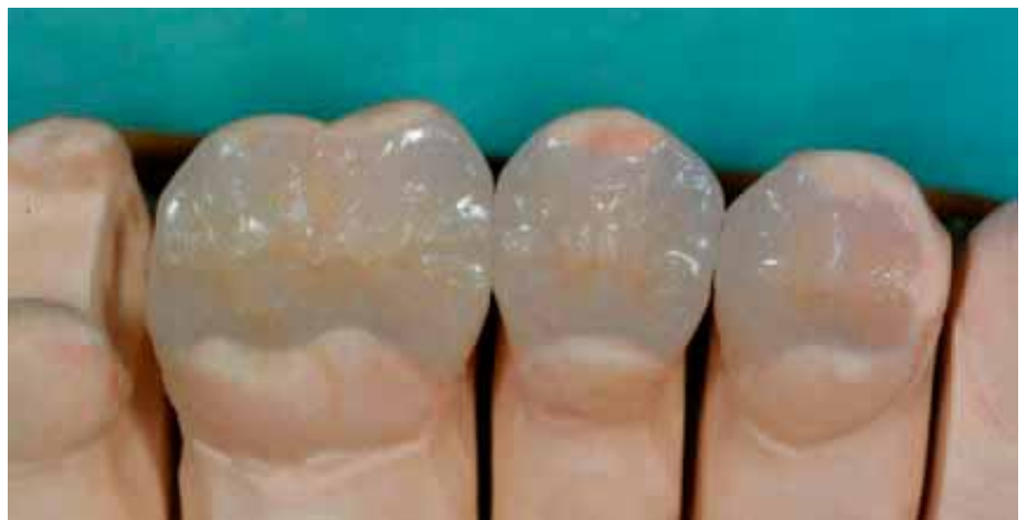
Keramik-Inlays auf dem Modell des Zahntechnikers

Allerdings gibt es durchaus auch Fälle, in denen sich die teure Versorgung auf Dauer als die preiswertere erweist. So hat die Arbeitsgemeinschaft für dentale Keramik