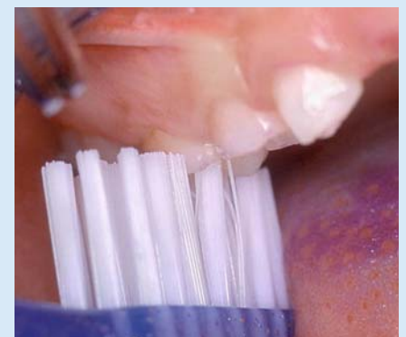
Abb. 7: Durch die Schrubbtechnik werden die neu durchbrechenden Zähne hinter den Milchzähnen nicht erreicht. Hier hilft die Querputztechnik!