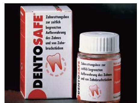
Abb. 10: In der Zahnrettungsbox können abgeschlagene Zahnteile oder ausgeschlagene Zähne perfekt aufbewahrt werden, um beim Zahnarzt ein Wiederansetzen oder Einheilen zu ermöglichen

Bei korrektem Vorgehen können verletzte Zähne einen Unfall meist überleben, wenn schnell gehandelt wird. Nachdem der Zahn gefunden ist, lautet die Regel: Möglichst schnell den Zahn wieder an seinen Platz bringen! Wenn ein Tetanusimpfschutz vorhanden ist (siehe Impfausweis, oder fragen Sie Ihren Hausarzt), sollte der Zahn unter fließendem Wasser abgespült, in das Zahnfach zurückplatziert und dort festgehalten werden. Und dann ab zum Zahnarzt, wobei oberstes Gebot bei einem herausgeschlagenen Zahn ist, ihn niemals trocken zu lagern. Ein Einwickeln ins Taschentuch oder ein Aufbewahren in der Hosentasche sind damit absolut tabu. Es ist sehr wichtig, den ausgeschlagenen Zahn richtig zu retten. Am besten ist es, den Zahn oder Zahnteile sofort in einer Zahnrettungsbox mit einer speziellen Nährstofflösung aus der Apotheke namens Dento-safe (Abb. 10) zu lagern.