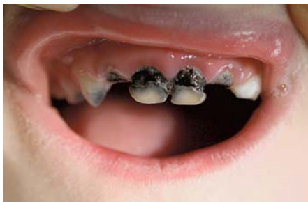
Abb. 1: Die kariöse Zerstörung der Milchzähne bei der Nuckelflaschenkaries hat weitreichende zahnmedizinische, kieferorthopädische und allgemeinmedizinische Folgen

Wiederholt wurde ein Zusammenhang zwischen der Gabe von zuckerhaltigen Getränken aus der Nuckelflasche und der frühkindlichen Karies nachgewiesen, daher spricht man häufig von der Nuckelflaschenkaries. Aktuelle Studien zeigen, dass 10 bis 15% aller Kinder betroffen sind. Doch gerade die Nuckelflaschenkaries ist mit wenigen und einfachen Maßnahmen zu vermeiden: