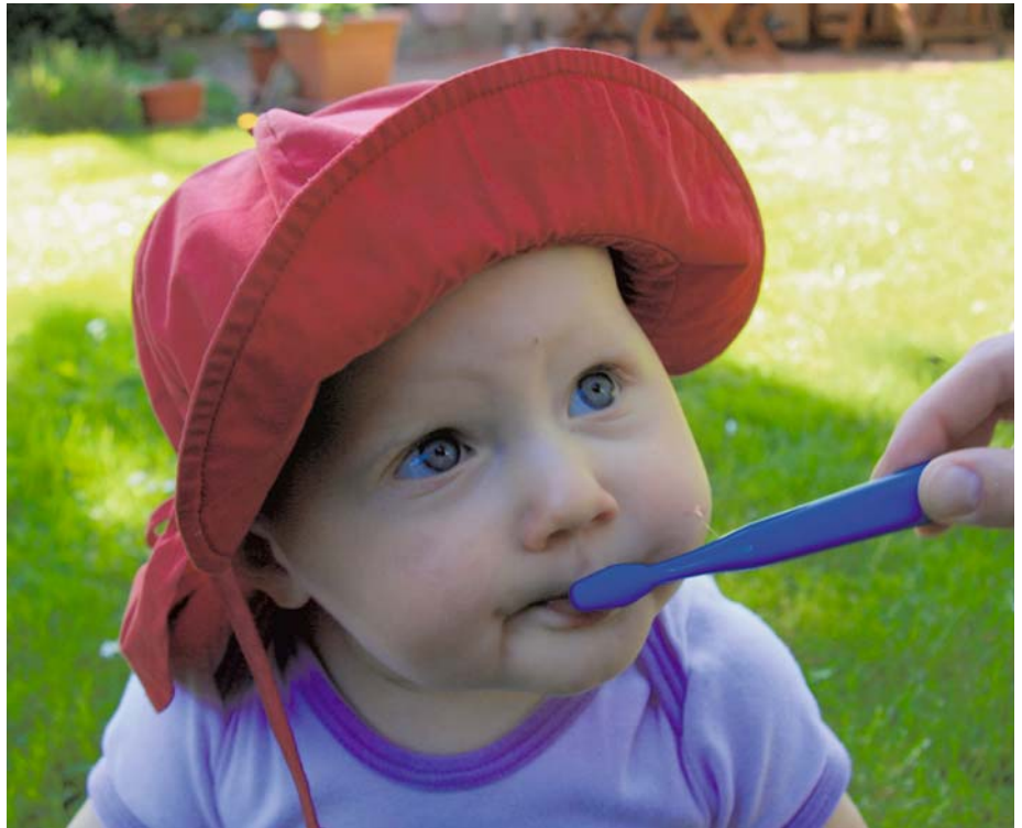
Abb. 2: Mundhygiene vom ersten Zahn an ist ein Muss - Kleinkinder sind hierbei voll auf ihre Eltern angewiesen

Zucker ist für eine ausgewogene Ernährung nicht notwendig, sondern führt schnell zu Übergewicht. Der Geschmack von Zucker ist Gewöhnung. In der Folge schmecken Kinder, die „süß“ nicht gewohnt sind, Speisen und Getränke auch weniger süß. Geben Sie Ihrem Kind keine zuckerhaltigen Getränke (insbesondere gesüßte Tees, Instanttees, Obstsäfte, verdünnte Obstsäfte) aus der Nuckelflasche.