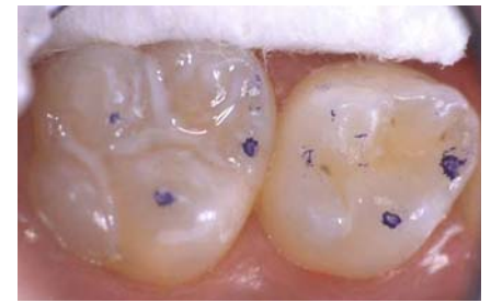
Abb. 6: Versiegelungen können die stark zerklüftete Kaufläche glätten, tiefe Rillen verschließen und so leichter pflegbar gestalten

Rillen zu verschließen und so leichter pflegbar zu gestalten (Abb. 6).