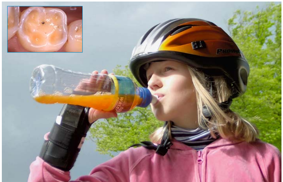
Abb. 11: Säurehaltige Getränke führen zu schmerzhaften Verlusten der Zahnhartsubstanz

anderfolgenden Tagen sein, das vom Betroffenen geführt wird, um so auf erosive Quellen in der Nahrung sowie auf die Häufigkeit und Art der Säureeinwirkung aufmerksam zu werden. Zusätzlich sollte durch individuell verschiedene Fluoridierungsmaßnahmen zu Hause und beim Zahnarzt (Zahnpasten, Mundspüllösungen, Fluoridgele oder -lacke) ein weiterer Mineralverlust der Zähne reduziert bzw. verhindert werden. Bei der Mundhygiene wird empfohlen, eine sanfte Bürsttechnik anzuwenden mit einer Zahncreme, die wenig Putzkörper enthält. Die Mundhygienemaßnahmen sollten ebenfalls nicht unmittelbar nach einer „Säureattacke“ erfolgen. Erst wenn die Zahndefekte so ausgeprägt sind, dass ästhetische und funktionelle Beeinträchtigungen bestehen, müssen entsprechende Therapiemaßnahmen ergriffen werden.