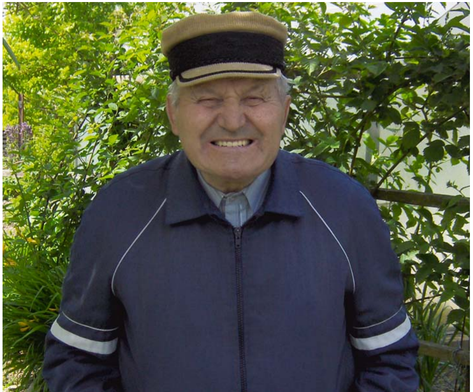
Abb. 12: Auch im Alter noch mit Biss durchs Leben gehen: mit der richtigen Mundhygiene und regelmäßigen Vorsorgeuntersuchungen beim Zahnarzt

Auch Erkrankungen des Zahnhalteapparates und Veränderungen der Mundschleimhaut nehmen im Alter deutlich zu. Regelmäßige Kontrollen und professionelle Zahnreinigungen der eigenen Zähne wie auch des herausnehmbaren Zahnersatzes sind dann empfehlenswert. Erkrankungen (wie z.B. Diabetes), aber auch Medikamente können direkt Einfluss auf Ihre Mundgesundheit haben. Teilen Sie eine Veränderung Ihres Gesundheitszustandes immer Ihrem Zahnarzt mit, damit er diese im individuellen Kariespräventionsplan mit berücksichtigen kann. Viele Medikamente