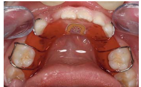
Abb. 5: Wenn Milchbackenzähne zu früh verloren gehen, drohen Lückeneinengungen. Ein rechtzeitig angefertigter Platzhalter (herausnehmbare Spange) kann dies verhindern.

Hier kommt das Einsetzen eines Lückenhalters (fest oder herausnehmbar) in Frage, der die Möglichkeit bietet, die Lücke für den nachfolgenden Zahn zu bewahren (Abb. 5).