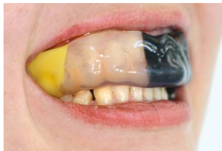
Abb. 9: Bei Trendsportarten wie z.B. Inlineskaten ist das Risiko von Zahnverletzungen besonders groß. Ein individueller Zahnschutz sorgt dafür, dass auch bei Risikosportarten das Zahnunfallrisiko gesenkt wird.

Immer häufiger kommt es beim Sport durch einen Sturz mit dem Fahrrad oder beim Skaten zu Verletzungen am Gebiss. Etwa jedes zweite Kind erleidet vor Vollendung des 16. Lebensjahres einen Zahnunfall. Vornehmlich sind die oberen Frontzähne aufgrund ihrer Lage im Zahnbogen betroffen. Der Zahnarzt spricht bei solchen Schäden, die von äußerlich nicht sichtbaren „Erschütterungen“ eines Zahnes oder Brüchen einer Zahnwurzel über abgebrochene Zahnkronenstücke bis zum vollständigen Ausschlagen/Eindrücken eines oder mehrerer Zähne reichen, von einem Zahntrauma. Um diesen schmerzhaften und langwierigen Verletzungen vorzubeugen, ist bei riskanten Freizeit- und Mannschaftssportarten ein individueller Mundschutz aus Kunststoff empfehlenswert (Abb. 9).