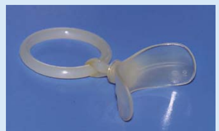
Abb. 4: Durch intensives Nuckeln können unschöne Zahnfehlstellungen erzeugt werden, die durch eine kieferorthopädische Frühbehandlung z.B. mit einer Mundvorhofplatte behoben werden sollten