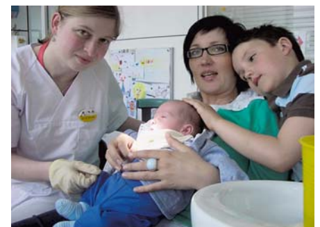
Abb. 3: Ein Beratungstermin von jungen Müttern in der Zahnarztpraxis ermöglicht nicht nur eine individuelle Prophylaxe und Weitergabe von Tipps, sondern auch eine Gewöhnung an die Behandlung von klein auf

oben, um die Zähne Ihres Kindes genau zu sehen. Achten Sie darauf, dass Sie beim Zähneputzen alle Zähne und alle Zahnflächen (Kaufläche, Außenfläche, Innenfläche) reinigen. Mit etwa dem zweiten Lebensjahr beginnen Kleinkinder mit den ersten eigenen Putzversuchen. Trotzdem, richtiges Zähneputzen ist nicht leicht. Elterliches Nachputzen und Kontrollen sollten daher bis mindestens zum sechsten Lebensjahr erfolgen. Ab dem zweiten Lebensjahr sollte 2x täglich (morgens und abends) mit Zahncreme geputzt werden.