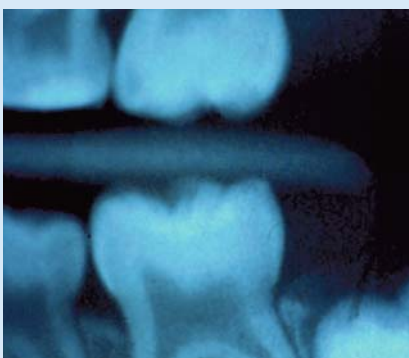
Abb. 8: Röntgenbilder ermöglichen die Diagnose von versteckter Karies zwischen den Zähnen. Ab dem 12. Lebensjahr steigt die Gefahr für Karies an diesen Flächen an.

Abhängig vom Alter der Patienten entsteht die Karies an unterschiedlichen Stellen, die vom Zahnarzt gezielt mit unterschiedlichen Untersuchungsmethoden diagnostiziert werden. Im Jugendalter häufen sich „Löcher“ am Kontaktpunkt zweier Zähne, die man als Zahnzwischenraumkaries oder Approximalkaries bezeichnet. Dieser Zahnzwischenraum ist mit der natürlichen Reinigung und der Zahnbürste schwer bis gar nicht zu erreichen. Außerdem ist diese Kariesform sehr schwer festzustellen, da sie klinisch kaum einsehbar ist und nur etwa jedes dritte „Loch“ auch als solches erkannt wird. Deshalb sollten Röntgenbilder in Form von Bissflügel-aufnahmen (Abb. 8) angefertigt werden, da unterschiedliche Kariestadien in diesem Bereich mit bloßem Auge nicht unterschieden werden können. Diese Röntgenbilder sollten, je nach individuellem Risiko, in unterschiedlichen Abständen wiederholt werden, um über mögliche Therapiemaßnahmen zu entscheiden. Dabei muss nicht gleich jede Karies mit einer Füllung versorgt werden. Wenn die Oberfläche des Zahnes noch intakt ist, können das Fortschreiten der Karies durch gezielte Fluoridanwendungen gehemmt und eine Rückmineralisation bewirkt werden. Ein wichtiges Hilfsmittel ist dabei die fluoridierte Zahnpaste.