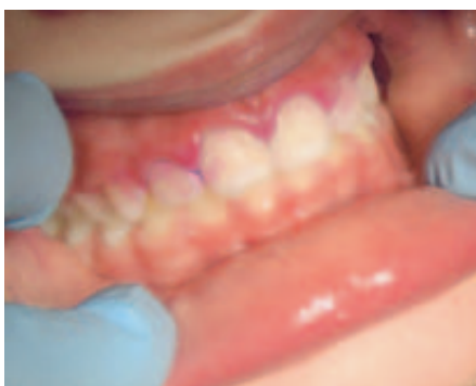
Gerötetes Zahnfleisch im Wechselgebiss. Die Anfärbung zeigt die Beläge auf den Zähnen durch mangelhaftes Putzen.

Ist dieser Verschluss längere Zeit beschädigt, können Bakterien entlang der Wurzel in die Tiefe eindringen, den Zahnhalteapparat zerstören, und der Zahn wird locker. Diese Krankheit wird im Oberbegriff als Parodontitis bezeichnet. Sie hat verschiedene Erscheinungs- und Ursachenformen. Im Kindheits- und Jugendalter tritt die Parodontitis zum Glück sehr selten auf. Allerdings kennen wir auch die Form der Jugendlichen (Juvenilen) Parodontitis.