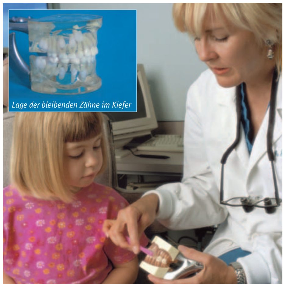
Lage der bleibenden Zähne im Kiefer

Noch einmal zurück zum Milchgebiss: Wenn alle Milchzähne an ihrem Platz stehen und gesund sind – wir sagen dazu „primär gesundes Milchgebiss“ – dann hat das Kind sehr gute Chancen, ein gesundes bleibendes Gebiss zu bekommen. Am besten ist es, wenn die Frontzähne etwas lückig stehen. Dann ist auch genügend Platz für die bleibenden Zähne.