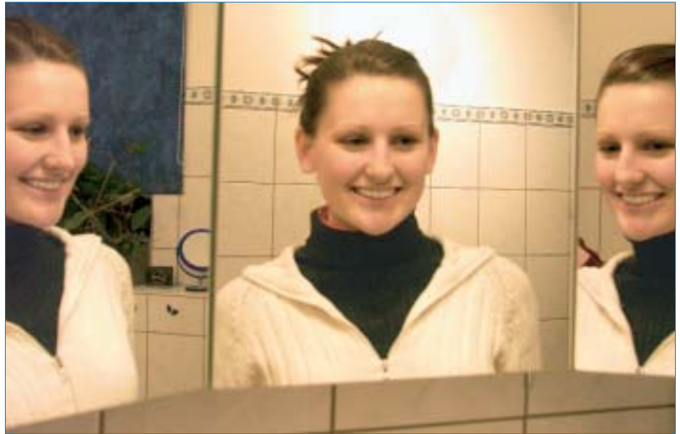
Übungen zur Aktivierungen der Gesichtsmuskulatur – das schönste Lächeln gehört ganz besonders dazu

Das so genannte Hausübungsprogramm sollte nicht zu umfangreich und mit dem Arzt abgestimmt sein.