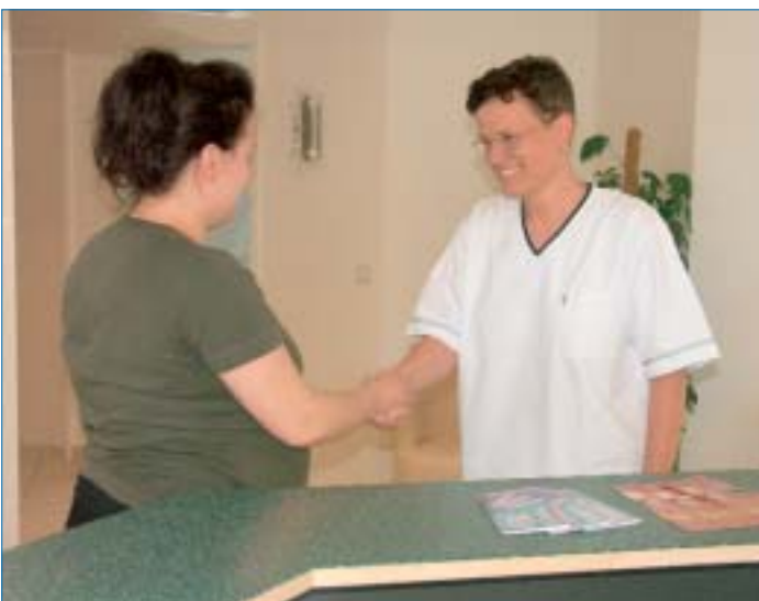
Zweimal sollte eine werdende Mutti während der Schwangerschaft den Hauszahnarzt aufsuchen – auch im Interesse des künftigen Kindes.

Jede werdende Mutti sollte in ihrer Schwangerschaft möglichst zweimal von ihrem Zahnarzt eine Kontrolluntersuchung vornehmen lassen. Die erste Untersuchung sollte etwa im vierten Schwangerschaftsmonat stattfinden. Zu diesem frühen Zeitpunkt der Schwangerschaft schaut der Zahnarzt insbesondere nach dem Zustand des Zahnfleisches, untersucht aber auch die Zähne. Die zweite Kontrolluntersuchung sollte noch einmal kurz vor dem Ende der Schwangerschaft, im achten Monat, stattfinden. Bei dieser Untersuchung schaut der Zahnarzt dann besonders nach dem Zustand der Zähne. Sind die Zähne der Mutti nämlich gesund oder saniert, das heißt mit Füllungen oder Zahnkronen versorgt, ist die Wahrscheinlichkeit, dass auch das Kind kariesfreie Zähne erhält, wesentlich größer, als wenn die Mutti behandlungsbedürftige Zähne hat. Zusammenfassend kann also gesagt werden – eine gute und regelmäßige Zahn- und Mundpflege, eine ausgewogene und gesunde Ernährung, kombiniert mit regelmäßigen Kontrollbesuchen beim Zahnarzt haben dem alten Spruch „Ein Kind – ein Zahn“ seine Gültigkeit genommen. Viel besser in unsere heutige Zeit passt da der Spruch: „Eine gesunde Mutti – ein gesundes Kind“.