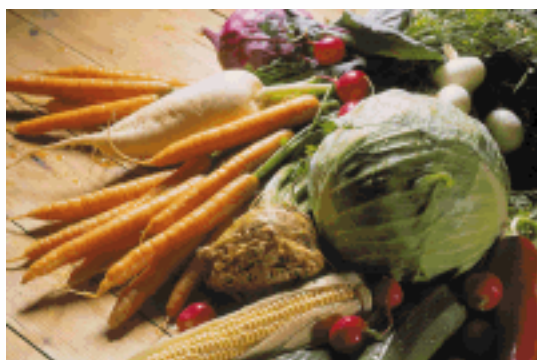
Ein Paket gesunder Ernährung - für Ihre Zahngesundheit!

Bereiten Sie sich also darauf vor, diese Frage beantworten zu können. Wenn Sie schon die Erfahrung gemacht haben, dass Sie vor lauter Aufregung oder Beklemmung einiges von dem, was Sie ihm sagen wollten, vergessen haben, dann schreiben Sie sich doch selbst einen kleinen "Spickzettel". Der ist - weil es sich schließlich beim Zahnarztbesuch um keine Prüfung handelt - nicht nur erlaubt, sondern geradezu erwünscht, denn Ihre Aussagen können der Wegweiser zur richtigen, ohne Umwege gestellten Diagnose sein.