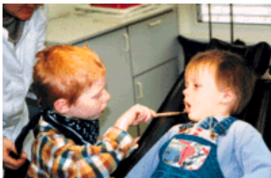
Spielerisch lernen die Knirpse, wie's beim Zahnarzt zugeht.

Setzen Sie Ihr Kind vor dem Zahnarztbesuch nicht unter Erfolgsdruck, das schafft zusätzliche Anspannung, die einer unverkrampften Reaktion auf die Behandlungssituation abträglich ist. Machen Sie ihm auch keine Vorwürfe, wenn es nicht artig und "tapfer", sondern ängstlich war oder gar die Behandlung verweigert hat.