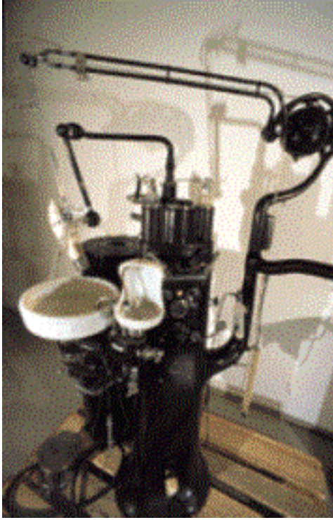
Solche Schmuckstücke stehen heute im Museum: Behandlungseinheit vor 1930. (Dresdner Hygienemuseum, Sammlung/ Depot)

Im Gegenteil: Das, was man normalerweise im Behandlungszimmer sieht, ist längst nicht alles, was an modernster Technik zu einer Zahnarztpraxis gehört. Kompressor, Amalgamabscheider, Sterilisator und Ultraschallreinigungsgerät, Röntgenapparatur mit Entwicklungsgerät für die Filme, Polymerisationslampe für Kunststoff-Füllungen - der Zahnarzt bedient sich eines recht umfangreichen Parks an technischen Geräten, und fast jeder - durchaus auch die Zahnärztinnen! - ist in der Lage, kleinere Reparaturen an einzelnen Stücken auszuführen, falls trotz regelmäßiger technischer Überprüfungen doch einmal irgendwo etwas klemmt.