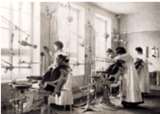
Straßburger Schulzahnklinik um 1900.

In den Schubkästen der Schränke im Behandlungszimmer liegen diverse Instrumente bereit, die die Ziselierarbeit an Ihren Zähnen ermöglichen: Spiegel, Sonden, Pinzetten, Füllungsinstrumente in verschiedenen Ausführungen, Matrizen, verschiedene Bohrer, dazu Polierer, Wurzelkanalinstrumente, Hebel, Spritzen, Kanülen ... - Zangen, einst das typische Hilfsmittel des "Zahnreißers", sind nur noch ein Instrument unter vielen.