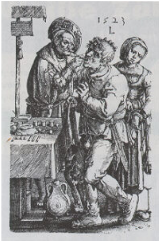
Lucas van Leyden: Zahnbehandler (1523).